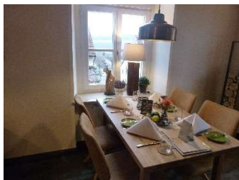
Grünes Stüble Neuses