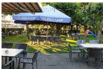
Biergarten „Zur Tauberbrücke“