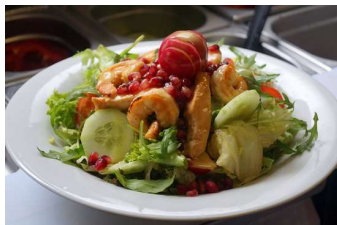
Trattoria „Da Mamma Tina“