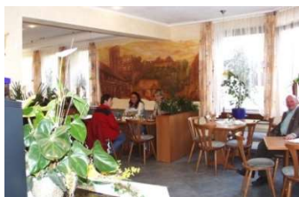
Café u. Bäckerei Bamberger