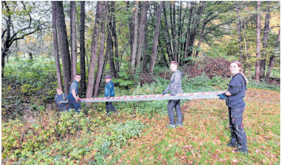
Die Jugendfeuerwehr erhielt mit ihrem Biotop-Projekt erst vor kurzem den Kulturlandschaftspreis des Schwäbischen Heimatbundes.

Bereits seit vielen Jahren laufen viele verschiedene Projekte, die diesen Aspekt explizit berücksichtigen. Exemplarisch seien an dieser Stelle verschiedene Maßnahmen genannt: