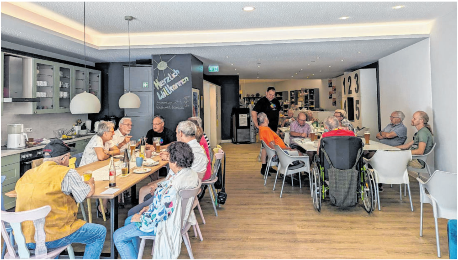
Aus der ehemaligen Schleckerfiliale am Möhlerplatz wurde zwischenzeitlich das BürgerLädle. Es ist Laden, Postfiliale und Treffpunkt in einem. Beim monatlichen Weißwurst-Frühstück treffen sich alle Generationen. Der Gewinn wird an eine soziale Einrichtung gespendet.