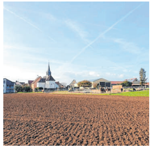
Impressionen aus der Gemeinde Igersheim: links oben: Ortsansicht von Igersheim (Bild: Stefan Ikas), rechts oben: Neugotische Franziskuskirche in Bernsfelden (Bild: Wolfgang Wittlich), unten links: Museumsschmiede Neuses (Bild: Wolfgang Wittlich), Ortsansicht Harthausen (Bild: Franziska Blau), Simmringen (Bild: Gemeinde Igersheim)