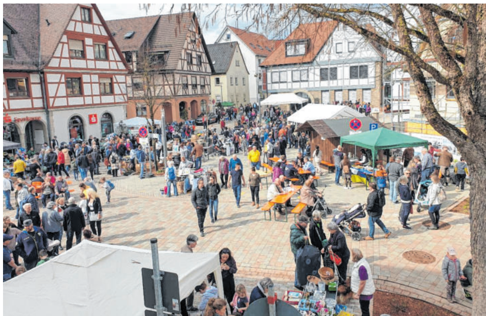
Der Dorfflohmarkt ist eine von vielen Aktivitäten des BürgerNetzWerks.

Aus der „Zukunftswerkstatt Familienfreundliche Kommune“ (siehe Seite 11) ging in Igersheim ein Agenda-Arbeitskreis Bürgernetzwerk Igersheim hervor, der schließlich 2009 zur Gründung des „BürgerNetzWerks“ (BNW) führte, gefördert durch den „Pakt Zukunft“ der Region Heilbronn Franken. Es handelt sich um ein ehrenamtliches Forum in der Gemeinde Igersheim für Bürgerbeteiligung mit hauptamtlicher Koordination. Die wichtigsten Handlungsfelder sind: Familiengerechtigkeit als strategisches Ziel, Vereinbarkeit von Familie und Beruf, Bildungsangebote und -infrastruktur, Stärkung von Familienkompetenzen, familiengerechte Infrastruktur und das Miteinander der Generationen. Das BürgerNetzWerk war und ist involviert in das Auditverfahren „Familiengerechte Kommune“, in die Entwicklung eines städtebaulichen Rahmenplans für Igersheim sowie in diverse Förderprojekte.