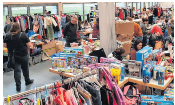
Beliebt sind die (Hallen-)Flohmärkte und die Kinderkleiderbörse in Igersheim.