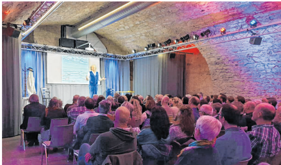
In regelmäßigen Abständen finden im Kulturkeller Bühnenveranstaltungen statt. Der Keller kann aber auch für andere Zwecke wie Feiern oder Firmenevents angemietet werden.