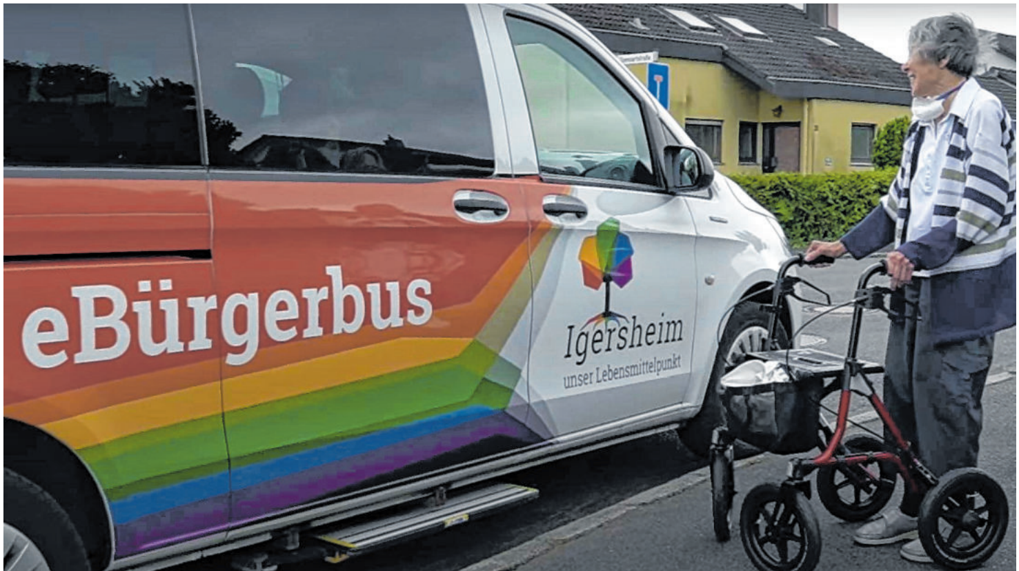
Der „eBürgerbus“ war bei seiner Einführung 2014 deutschlandweit der erste voll batterieelektrisch angetriebene Bürgerbus.

Unterwegs in Igersheim: Mobilität, Verkehr und Digitale Infrastruktur werden auf die Zukunft ausgerichtet.