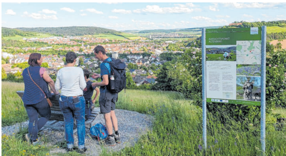
Wanderer an einem „Ort des Glücks“ auf dem Altenberg.