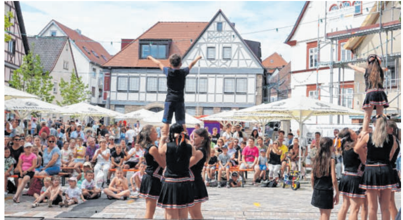
Die Masken der Fastnachtsgesellschaft „Kalrobia“ e. V. sind weit über Igersheims Grenzen hinaus bekannt. Beim Gassenfest mit Straßenkünstlertreffen (Bild rechts) gibt's im Sommer „Spaß auf der Gass!“.