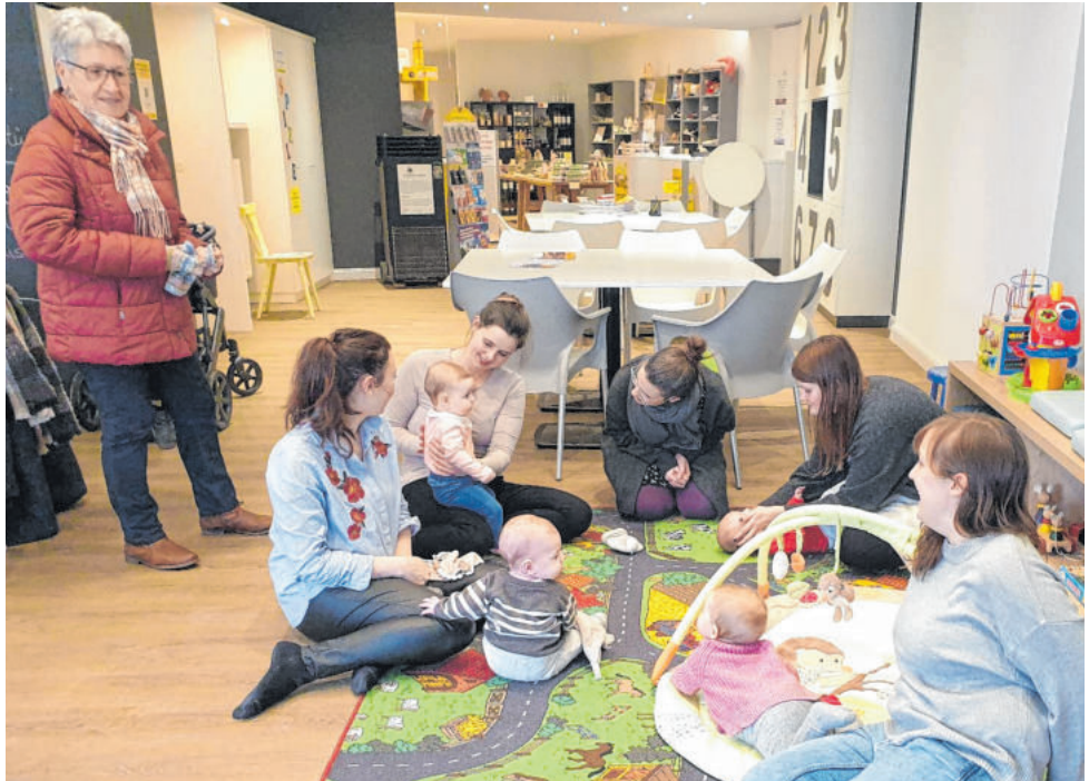
Das Eltern-Plausch-Café im BürgerLädle ist eines von vielen Angeboten der familiengerechten Kommune.

Die Gemeinde Igersheim baut die Bereiche Familienfreundlichkeit und Familien- und Generationengerechtigkeit weiter konsequent aus.“