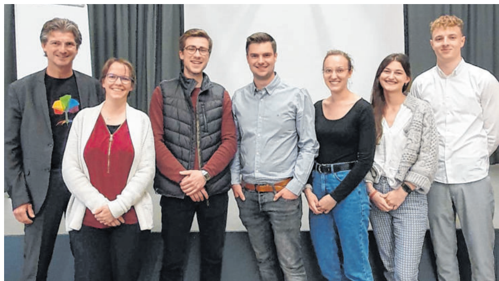
Seit zwei Jahren ist die Gemeinde im Rahmen des Integrationsseminars Kooperationspartner der DHBW. Diese Zusammenarbeit soll auch in Zukunft weitergeführt werden.

Die Homepage der Gemeinde Igersheim [ www.igersheim.de ] wurde neu gestaltet. Die Bürger – und alle weiteren Interessierten – bekamen die Möglichkeit, einen Newsletter zu abonnieren. Für die Social Media-Auftritte auf Instagram und Facebook richtete die Gemeinde mit STAGE zusätzlich eine Möglichkeit ein, datenschutzkonform auf die veröffentlichten Informationen zuzugreifen. Über den „ Mängelmelder “ können Igersheimer Bürgerinnen und Bürger jederzeit Verbesserungsvorschläge oder Beschwerden bei der Gemeinde einreichen. Den Mängelmelder gibt es als gleichnamige, kostenlose App in den App-Stores von Google und Apple. Meldungen können aber auch per Internetbrowser ohne App erfasst werden. [ www.igersheim.mängelmelder.de ]