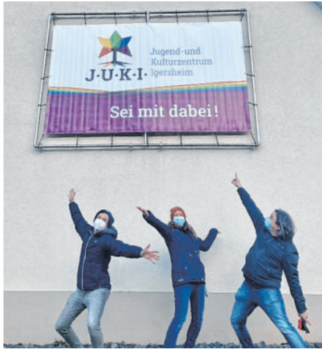
Seit 2021 heißt das Bürgerhaus Jugend- und Kulturzentrum. Auch weiterhin sind alle Altersklassen herzlich willkommen. BILD: J.U.K.I.-TEAM

Heute ist das Audit Familiengerechte Kommune für Igersheim ein wichtiger Standortfaktor. Hier werden die Handlungsfelder definiert und mit Maßnahmen unterlegt, die sich direkt und stark auf die Menschen vor Ort auswirken. Hier wird vor allem über das BürgerNetzwerk eingeladen zum Mitgestalten, Impulse werden gegeben und aufgenommen, Audit-Ziele werden mit anderen Gemeindeentwicklungsprozessen verbunden und finden sich im Leitbild der Gemeinde als verbindliche Handlungsmaxime wieder. bc/gi •