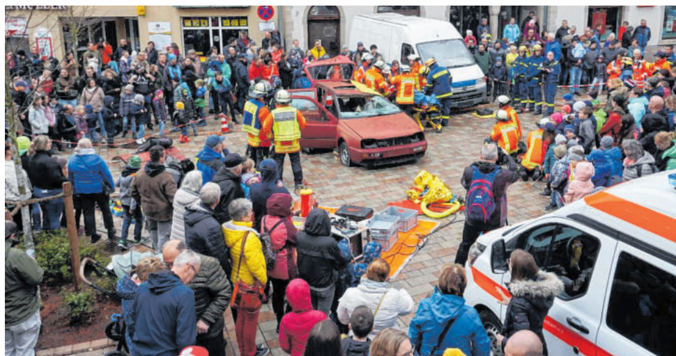
Die drei ortsansässigen Hilfeorganisationen in Igersheim – Deutsches Rotes Kreuz, Freiwillige Feuerwehr und Technisches Hilfswerk – demonstrierten beim „Blaulichttag“ im April auf dem Möhlerplatz ihre Fähigkeiten und zeigten, wie gut ihre Zusammenarbeit funktioniert. Am 15. Juli 2023 bietet sich beim Tag der Vereine nun die Gelegenheit, andere Vereine aus Igersheim näher kennenzulernen.

→ Der noch relativ junge Verein IgersWein möchte mit Glühweinabend, Mittsommereinprobe und Feierabend-Schoppen die Igersheimer für die seit kurzem wieder am heimischen Weinberg angebauten Tropfen und das Thema Wein begeistern. Brotbacken im Holzofen am Kulturhaus bietet der Heimatverein Messklingschlapp an.