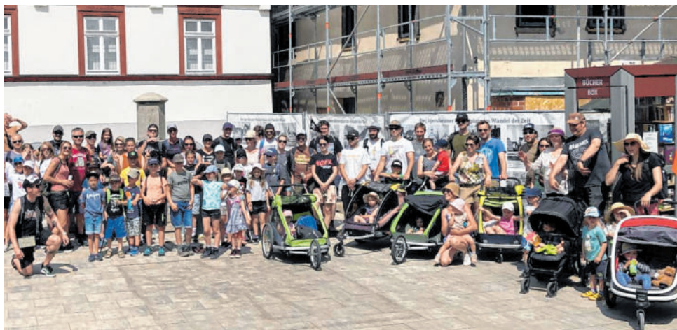
Beim J.U.K.I.-Event „Punk is d(e)ad - and mom“ wanderten Punkrocker*innen, die teilweise selbst Kids haben, zu zwei Stationen, an denen Live-Musik gespielt wurde.