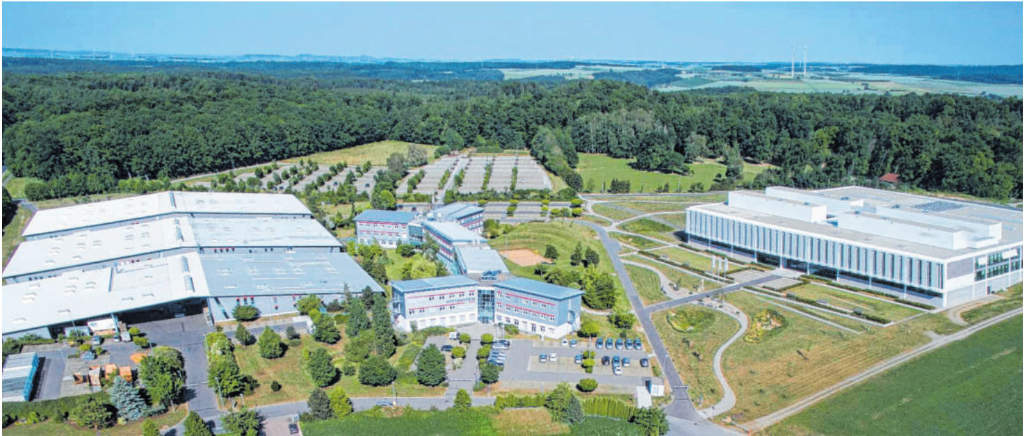
Das Unternehmen Wittenstein SE im Igersheimer Ortsteil Harthausen.