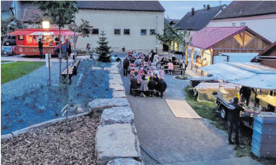
Nach Neugestaltung des Dorfplatzes in Neuses trifft sich Alt und Jung hier gerne zum Feiern.