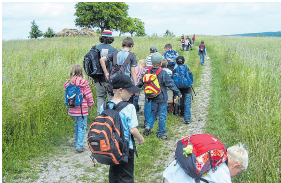
Die Ferienbetreuung richtet sich an Kinder im Grundschulalter. Das Team von Hort und Jugendarbeit macht hier vor allem Ausflüge in die nähere Umgebung.

→ Der Gemeinderat Igersheim schuf nachhaltige personelle Ressourcen und nahm das Angebot an. Fortan wurden die Igerheimerinnen und Igerheimer in ihrer Arbeit vom Verein „Familiengerechte Kommune e.V.“ begleitet und unterstützt. Das Ziel, die Erlangung des Zertifikats „Familiengerechte Kommune“, war – moderiert vom Verein Familiengerechte Kommune – bereits nach einem Jahr erreicht.