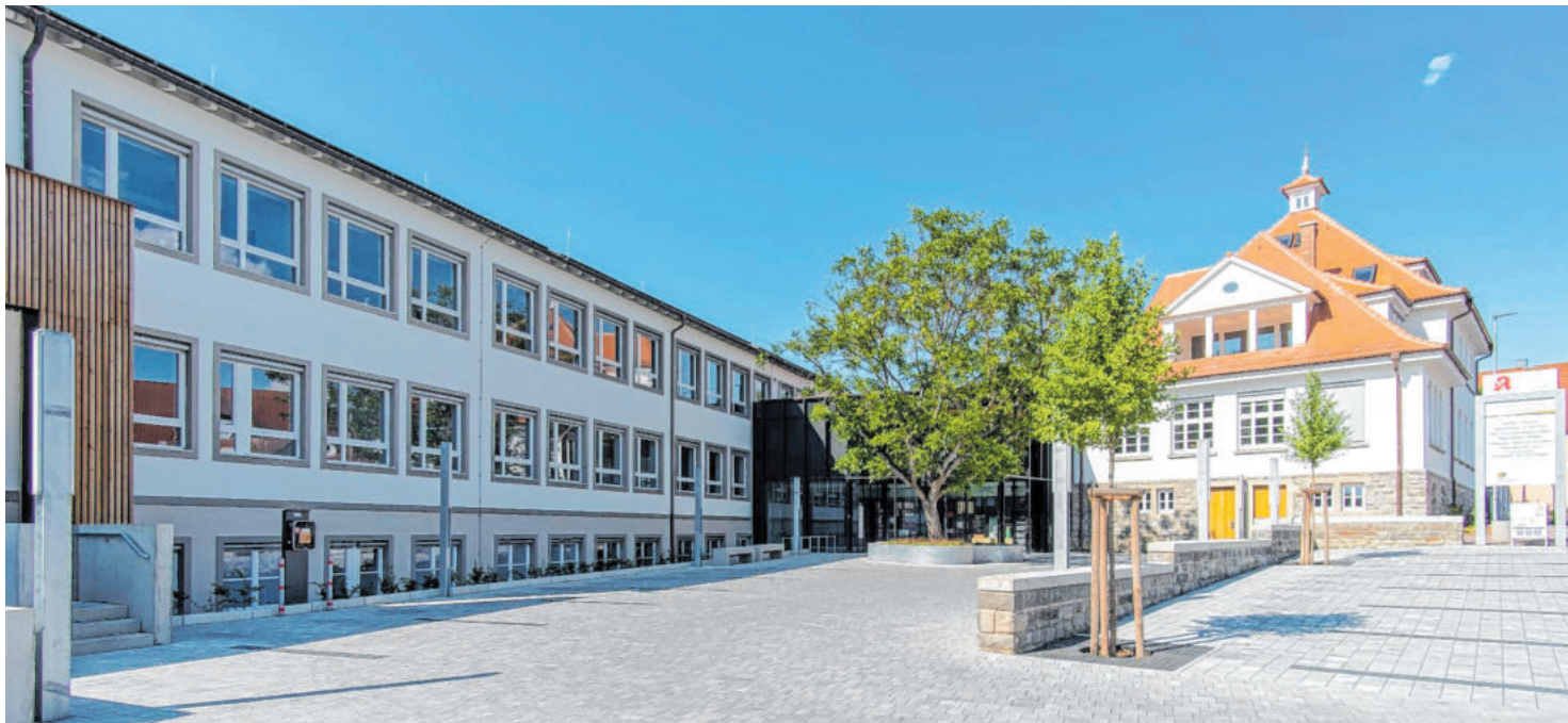
Das Gesundheitszentrum wurde im Mai offiziell eingeweiht. Hier wurden die bestehenden Gebäude von ehemaliger Grundschule und historischem Schulgebäude genutzt, um die Gesundheitsversorgung in Igersheim zu verbessern.