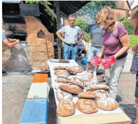
Gelebte Gemeinschaft – zum Beispiel beim Brotbacken am Holzofen.

→ Durch seine Lage im Taubertal, nahe der Stadt Bad Mergentheim, empfahl sich Igersheim immer schon als Wohnort und Ort für Geschäftstätigkeiten. Durch die gezielte Entwicklung mit Beteiligung der Bürger wurde dieses Potenzial geschickt genutzt und ausgebaut. Gewerbegebiete entstanden, Wohnraum wurde geschaffen, die Verkehrsanbindung optimiert und die Lebensqualität in den Ortsteilen maßgeblich gesteigert. Für Urlaubsgäste entstanden und entstehen neue attraktive Angebote für einen Aufenthalt in Igersheim